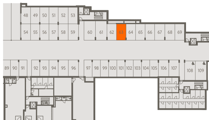
2. PP | 2nd basement

*Podlahová plocha je vypočtena podle nařízení vlády č. 366/2013 Sb. jako půdorysná plocha ohraničená vnitřními stranami obvodových zdí bytu včetně půdorysné plochy všech svislých nosných i nenosných konstrukcí uvnitř bytu. Nezahrnuje balkony, lodžie, terasy, předzahrádky a jiné zpevněné plochy.